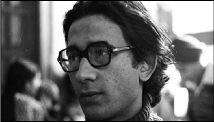
सफ़रदार हाशमी (12 अप्रैल, 1954 - 02 जनवरी, 1989)